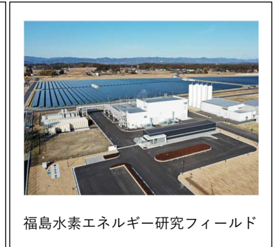
福島水素エネルギー研究フィールド