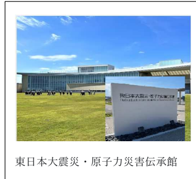
東日本大震災・原子力災害伝承館